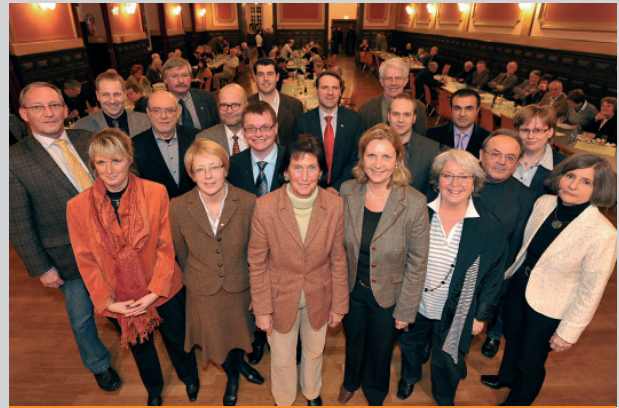
Die CDU-Kandidaten für den Stadtrat: Gemeinsam für Soest!